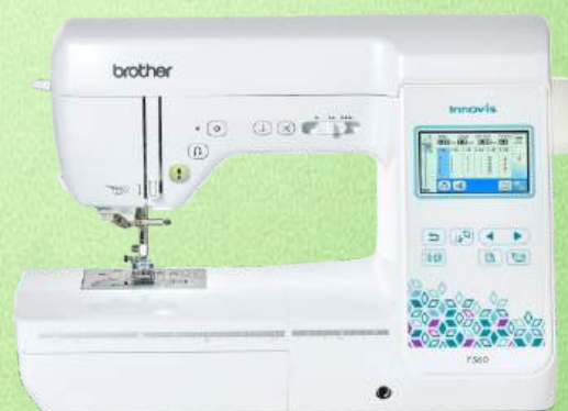
Näh-und Quiltmaschine BROTHER Innov-is F560

140 einprogrammierte Stiche einschließlich Knopflochvarianten 10 ein-Stufen-Knopflöcher - LCD-Bildschirm - Stopp-Position der Nadel Punktverriegelung - Automatisches Einfädeln - Aufspulautomatik Klemmfreier Horizontalgreifer - Rechteckiges Transportsystem Nähfuß-Nivelliertaste - Verstellbarer Nähfußdruck (elektronisch) LED-Beleuchtung - Kniehebel - Zubehörfach - Kofferhaube - 3 Jahre Garantie