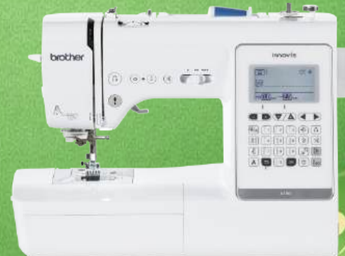
Nähmaschine BROTHER Innov-is F410

40 Nähstiche - 6 Knopflochvarianten Transportsystem rechteckig - Verstellbarer Nähfußdruck (mechanisch) LC-Display (2,7 Zoll) - Direktwahl der Nähstiche Automatischer Fadenabschneider - Extra-Komfort Nadeinfädler Unterfaden-Schnellautomatik LED-Beleuchtung 3 Jahre Garantie