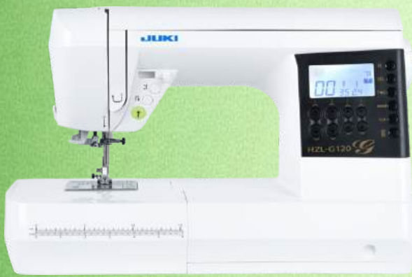
Computer Nähmaschine JUKI HZL-G120