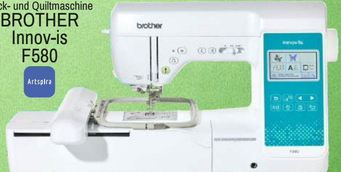
Stick- und Quiltmaschine BROTHER Innov-is F580