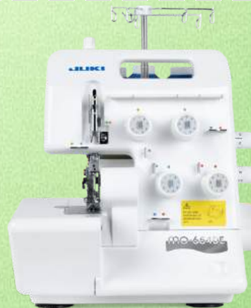
Overlock JUKI MO-654DE

Anzahl der Fäden: 2/3/4-Fäden Nähfußlüftung: zweistufig, max. 5 mm Easy-Snap-on-Fuß - Schnittbreitenverstellung mm-Differentialtransport Rollsaumeinrichtung - Manuelle Stichtlängeinstellung max. 4mm Nähgeschwindigkeit: max. 1500 Stiche/Min-Untergreifereinfädler Verstellbare Klinge - Stoff-Führung - Staubhülle - 2+2 Jahre Garantie