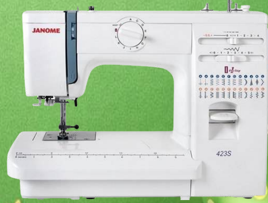
Mechanische Nähmaschine JANOME 423 S

20 Nutznähte Zick-Zack, Elastik Zick-Zack, Blindstich - 4 Stufen-Knopfloch Stichbreite 5 mm, Stichlänge 4 mm - LED Licht - Klemmfreier Horizontalgreifer Snap-on-Füßchen - Verstellbarer Füßchendruck - Nadeleinfädler Freiarm - Integriertes Zubehörfach - Inklusive Zubehör und Harthaube 5 Jahre Garantie