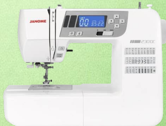
Nähmaschine JANOME 230 DC

30 Nähprogramme - Stichbreite 5 mm, Stichlänge 4 mm - helles LED Licht Vernähtaste - Transporteur von außen versenkbar Fadenspannungsregler für optimale Stiche - eingebauter Nadeleinfädler Freiarm - inklusive Zubehör und Staubschutzhülle 5 Jahre Garantie