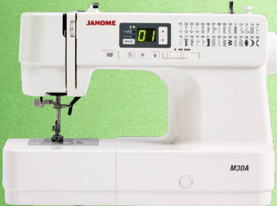
Nähmaschine JANOME M30A

Mechanische Freiarmnähmaschine mit CB-Greifer - 22 integrierte Nähprogramme 1-Stufen-Knopfloch-Automatik - 3-Stufen-Nähfußdruck - Stichwahlrad Extra hohe Nähfußhöhe - Stichbreite max: 5 mm, Stichlänge max: 4 mm Integrierter Nadeleinfädler - Helle LED-Beleuchtung - Großer Nähbereich Großer Durchlass - Großes Zubehörfach - Nähgeschwindigkeit bis zu 860 Stiche/min Staubschutzabdeckung - 5 Jahre Garantie