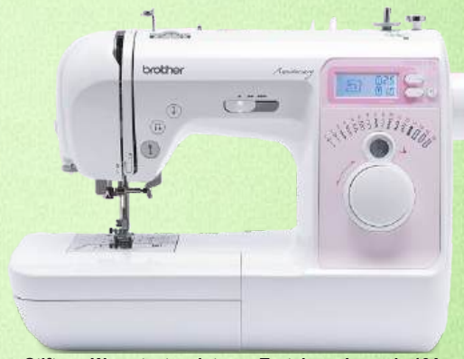
Nähmaschine BROTHER Innov-is A10

40 kreative Nähprogramme - Einfaches Einfädelsystem Start/Stopp-Taste - Schieberegler für Nähgeschwindigkeit Helle LED-Nähleuchte - Rückwärtsnähen - Fingerschutz Online-Anleitungen - 3 Jahre Garantie