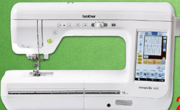
Näh-und Quiltmaschine BROTHER Innov-is VQ 2

Quilt Maschine XL - 210 mm Durchgangsbreite - Präzisionsdreh-Funktion - 232 Stiche - mit großem Anschlagbetisch - 99 Nutstiche, incl 10 Kopflöcher 5 Schriften - 133 Dekorstiche - Nähfußdruck (elektronisch) Taste zum Heben/Senken des Nähfußes - Punktverriegelung Komfortable Einfädelautomatik - ICAPS-Stoffsensoren - Präzisionsdreh Funktion - Seitlicher Stofftransport - LED-Beleuchtung - Kniehebel 3 Jahre Garantie