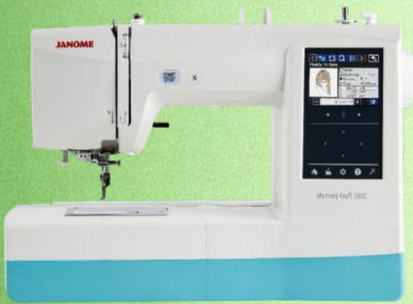
Stickmaschine JANOME MC 100 E