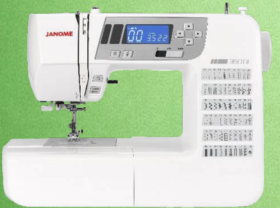
Nähmaschine JANOME 360 DC

Computergesteuert - 30 Nähprogramme - Stichbreite 7 mm - Nähfußdruckregulierung Freiarm + Anschietisch - LCD-Anzeige beleuchtet - 7-Segment-Transporteur Transporteur von außen versenkbar - Start/Stop-Taste - Einhandeinfädler Geschwindigkeitsregler stufenlos - Nadelstopp oben/unten - Zubehörfach - 5 Jahre Garantie