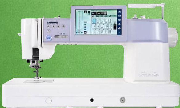
Prof. Quilt- Nähmaschine JANOME Continental M6

Highlight: inklusive A.S.R. Akkurat Stichregulator - Superior Nadeleinfädler Touchscreen 108 x 64,8 mm - Mirage Stich - Garnrollenhalter (2 Konen) PC-Software „Stitch Composer“ - 400 integrierte Stiche - 7 Schriften - 9 mm Großschrift Variabler Zick-Zack über Kniehebel - AcuGuide Stoffbahnführer - 5 Jahre Garantie Ausziehbares iLight™ 9-fach LED-Beleuchtung - leuchtet noch breiter