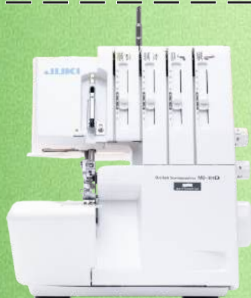
Overlock JUKI MO-114D