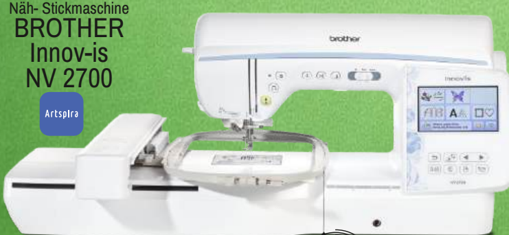
Näh- Stickmaschine BROTHER Innov-is NV 2700

193 einprogrammierte Stickmuster - 13 Stickschriften - 241 Nähstiche, 5 Nähschriften Stickfläche von 180 x 130 mm - Seitwärtstransport Auto. Oberfadenspannung - Auto. Fadenabschneider Fadenabschneider für Sprungstiche 190 mm (7,4 Zoll) Durchgangsbreite - Verbindung über WLAN Verbindung mit der App Artspira - My Custom Stitch™ - 3 Jahre Garantie