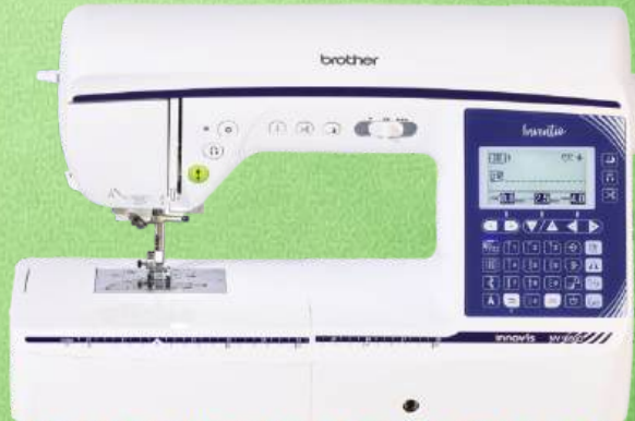
Näh-und Quiltmaschine BROTHER Innov-is NV 1850Q

182 einprogrammierte Stiche Nutz-und Dekorstiche - 10 ein-Stufen-Knopflöcher LCD-Bildschirm - Stopp-Position der Nadel - Punktverriegelung Automatisches Einfädeln - Aufspulautomatik - Klemmfreier Horizontalgreifer Rechteckiges Transportsystem - Verstellbarer Nähfußdruck (elektronisch) Seitlicher Stofftransport - Automatische Fadenspannung - LED-Beleuchtung Kniehebel - Zubehörfach - Kofferhaube - 3 Jahre Garantie