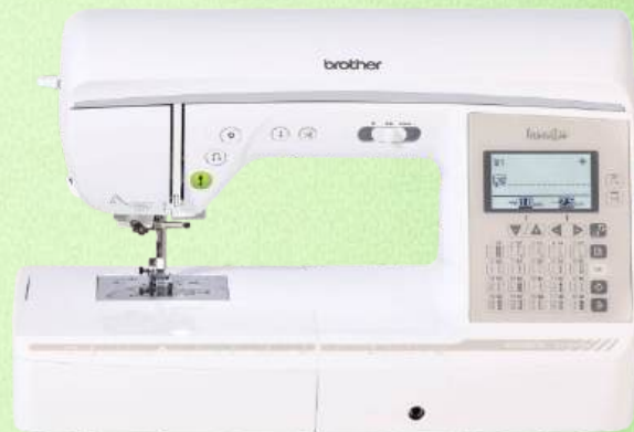
Näh-und Quiltmaschine BROTHER Innov-is NV1045SE

140 Nähstiche* (*inkl. Knopflochvarianten) - 10 Knopflochvarianten 5 Alphabete (nur Großbuchstaben) - Transportsystem rechteckig Verstellbarer Nähfußdruck (elektronisch) - LC-Display (3,5 Zoll) Zentrale Direktfunktionstasten - My Custom Stitch - Auto. Fadenabschneider Extra-Komfort Nadeinfädler - LED-Beleuchtung - 3 Jahre Garantie