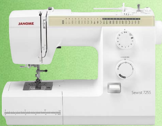
Mechanische Nähmaschine JANOME Sewist 725 S