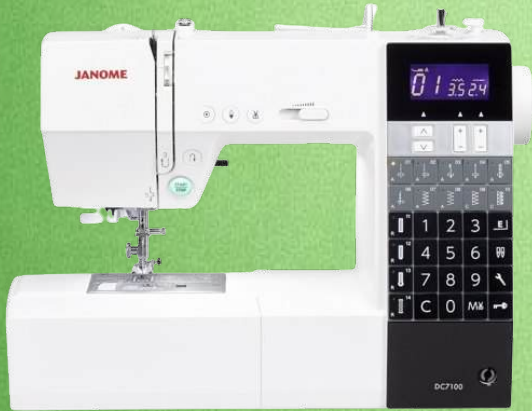
Nähmaschine JANOME 7100 DC inkl. großem Anschietisch

80 Nutz- und Zierstiche - 20 Direktauswahltasten - Autom. Vernähen auf Tastendruck Elektronische Fadenschere - 3 einstufige Knopflocher - Stichlänge 5 mm - Stichbreite 7 mm - Dreifachgeradstich bis zu 4 mm - Snap-On-System Nadeleinfädler - Multi-LCD Display - Start+Stopp-Taste Verstellbarer Nähfußdruck - LED Licht - Klemmfreier JANOME -Greifer - 5 Jahre Garantie