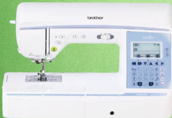
Näh-und Quiltmaschine BROTHER Innov-is NV 1350

182 einprogrammierte Stiche Nutz-und Dekorstiche - 10 ein-Stufen-Knopflöcher LCD-Bildschirm - Stopp-Position der Nadel - Punktverriegelung Automatisches Einfädeln - Aufspulautomatik - Klemmfreier Horizontalgreifer Rechteckiges Transportsystem - Verstellbarer Nähfußdruck (elektronisch) Seitlicher Stofftransport - Automatische Fadenspannung - LED-Beleuchtung Kniehebel - Zubehörfach - Kofferhaube - 3 Jahre Garantie