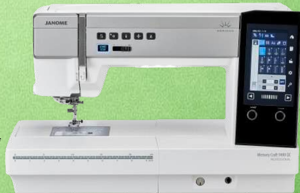
Prof. Quilt- Nähmaschine JANOME MC9480 QCP

300 integrierte Stiche, incl. 4 Alphabete - Max. Stichbreite: 9 mm / Max. Stichlänge: 5 mm Max. Nähgeschwindigkeit: 1.060 SPM - AcuFeed Flex™ - Top-Drop in Spulensystem Stitch Composer-Software zur Sticherstellung - 2 Stichplatten - Automatischer Fadenschnneider Superior Nadeleinfädler 2 - Farbiger 5-Zoll-LCD-Touchscreen - Automatische Fadenspannung 11 einstufige Knopflocher - Variabler Zickzackstich für freies Bewegungsküiten Automatischer Nähfußlift - 7-teiliger Transporteur - Nähfüße zum Aufstecken - 5 Jahre Garantie