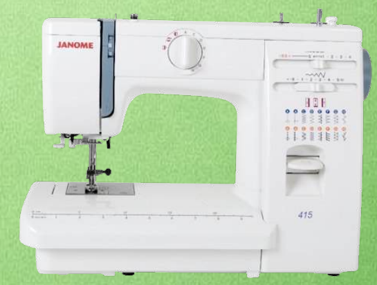
Mechanische Nähmaschine JANOME 415

Computergesteuert - 60 Nähprogramme - Stichbreite 7 mm - Nähfußdruckregulierung Freiarm + Anschietisch - LCD-Anzeige beleuchtet - 7-Segment-Transporteur Transporteur von außen versenkbar - Start/Stop-Taste - Einhandeinfädler Geschwindigkeitsregler stufenlos - Nadelstopp oben/unten - Zubehörfach 5 Jahre Garantie