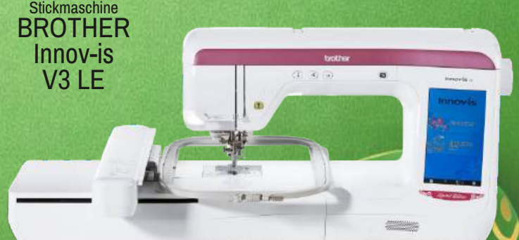
Stickmaschine BROTHER Innov-is V3 LE