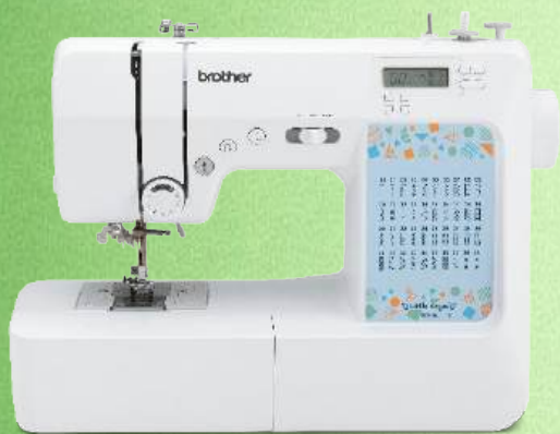
Nähmaschine BROTHER KD40S