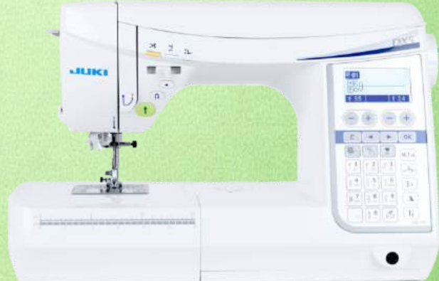
Computer Nähmaschine JUKI HZL-DX5

155 Stichmustern, Nutstiche, 3 Alphabete, Applikationsstiche, Dekorstiche 16 Knopflochvariationen - Durchlass: 200 x 115 x 210 mm - Box Transport Knopflocher in Industriequalität - Automatischer Fadenabschneider LED Beleuchtung Automatischer Nadeleinfädler - Verstellbarer Nähfußdruck Integriertes Zubehörfach - Stichbreite 7 mm Stichlänge 5 mm - Robuste Kofferhaube 2+2 Jahre Garantie