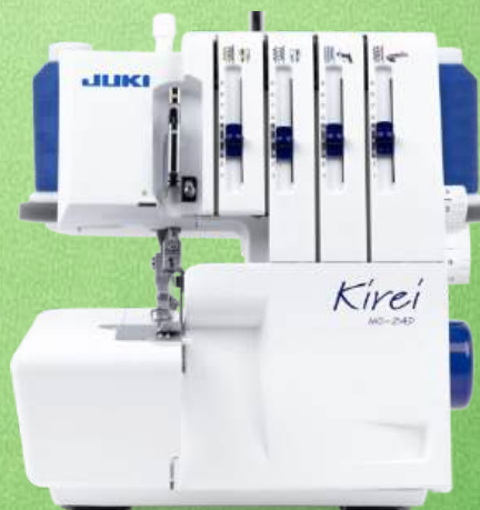
Overlock JUKI MO-214D Kirei

3/4 Fäden (2 Fäden optional) - Stichtlänge max. 4 mm, Stichbreite max. 7 mm Differentialtransport - Manuelle Fadenspannung - Rollsaumeinstellung Schnittbreitenverstellung - Abfallbehälter - 2+2 Jahre Garantie