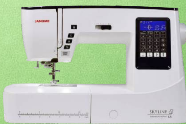
Nähmaschine JANOME Skyline S3 inkl. großem Anschietisch

100 Nutz- und Zierstiche - 14 Direkttasten - Automatisches Vernähen auf Tastendruck Elektronische Fadenschere - 6 Knopflocher - Zwillingsnadel-Taste für hohe Sicherheit Multiflex-Füßchen mit Snap-On-System - Einhandeinfädler - Multi-LCD Display Start+Stopp-Taste - Verstellbarer Nähfußdruck - Flächige LED Ausleuchtung - Kniehebel Klemmfreier JANOME -Greifer - Großer Anschietisch - 5 Jahre Garantie