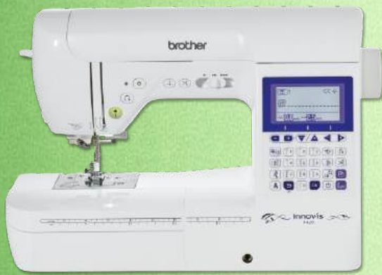
Nähmaschine BROTHER Innov-is F420