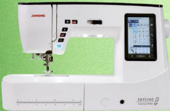
Nähmaschine JANOME SKYLINE S7 inkl. großem Anschiebetisch

200 Stiche incl. 9 Knopflocher -18 Nähfüße incl. Knopflochfuß mit Stabilisierungsplatte AcuFeed Flex breit - 2 Zusätzliche Schnellwechsel-Stichplatten - breiter Fußanlasser Durchlass 255 mm breit 120 mm hoch - Nähgeschwindigkeit bis zu 1200 Stiche/min Bis zu 9 mm Stichbreite - Superior Nadeleinfädler - LED Display 78,5 mm x 47,5 mm Helles Display - LED Leuchten an 3 Stellen - 20 stufiges digitale Helligkeitseinstellung Kniehebel - 5 Jahre Garantie