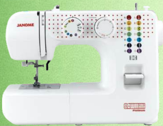
Mechanische Nähmaschine JANOME SewMini Platinum