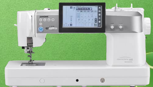
Prof. Quilt- Nähmaschine JANOME Continental M8 Prof.

400 integrierte Stiche, incl. 5 Alphabeten - Max. Stichbreite: 9 mm / Max. Stichlänge: 5 mm Max. Nähgeschwindigkeit: 1.300 SPM - Automatisches Spannsystem - Automatischer Nähfußlift 9 LED-Lampen - 7-Zoll-Farb-LCD-Touchscreen - StichComposer Sticherstellungs PC Software Unterstützung für Nähanwendungen auf dem Bildschirm - USB-Anschluss - 5 Jahre Garantie 13 Sensorknopflocher - Superior Nadeleinfädler - Erweiterte Plattenmarkierungen