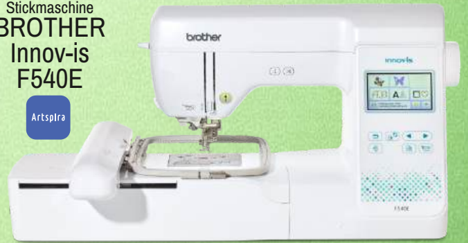
Stickmaschine BROTHER Innov-is F540E

200 Stickmuster inkl. 65 Walt Disney Designs - 181 Nutz- und Dekorstiche inkl. 10 Knopflochvarianten - 11 einprogrammierte Stickschriften Nähschriften 100 mm x 100 mm Stickfläche - Farbiger LCD-Touchscreen Geschwindigkeitsregler - Nadelposition oben/unten - Sieben-Punkt-Transporteur Komfort-Nadeleinfädler - Automatischer Fadenabschneider 160 mm Durchgangsbreite - Kreativ-App Artspira Eigene Stiche gestalten mit My Custom Stitch™ - 3 Jahre Garantie