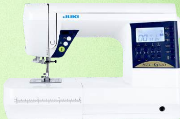
Computer Nähmaschine JUKI HZL-G320

180 Stichmuster, Applikationen, Dekorstiche und Quiltstiche - 7-Punkt-Transporteur Alphabet mit Groß- und Kleinbuchstaben - 8 verschiedene Knopflocher LED Beleuchtung - halbautomatischer Nadeleinfädler Spezieller Stahltransporteur für starken Transport bei schweren Stoffen Nähfußliftung bis zu 12 mm - Durchlass 203mm x 112mm - Robuste Kofferhaube Stichlänge 5 mm - Stichbreite 7mm - 2+2 Jahre Garantie