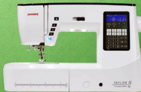
Nähmaschine JANOME Skyline S6 inkl. großem Anschietisch

170 Stiche - 10 automatische Einstufenknopflocher - 4 Nähschriften Superior Feed System Plus (SFS+) - Auto. Fadenspannung - Einstellbarer Nähfußdruck Klemmfreier Horizontalgreifer - Elektronische Fadenschere - Beleuchtetes LC Display 6 weiße LED Lampen - Arbeitsbereich: 210 mm x 120 mm - Start/Stopp-Taste Stichplattenschnellwechsel - Kniehebel - 7-Segment-Transporteur - 5 Jahre Garantie