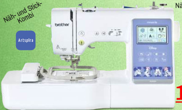
Näh- und Stickmaschine BROTHER Innov-is M380D