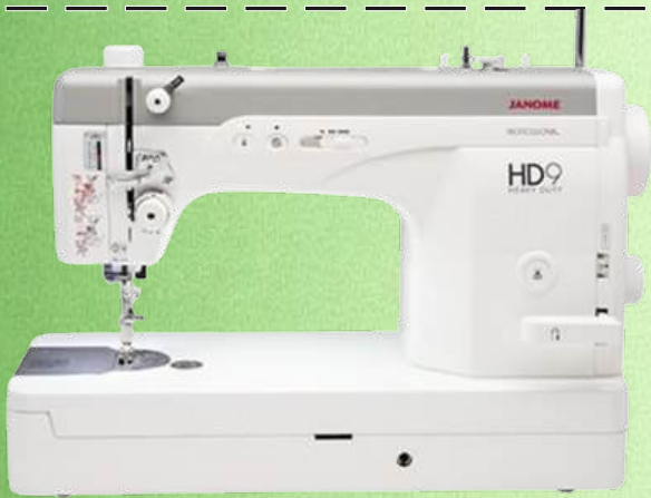
Schnellnäher JANOME HD9