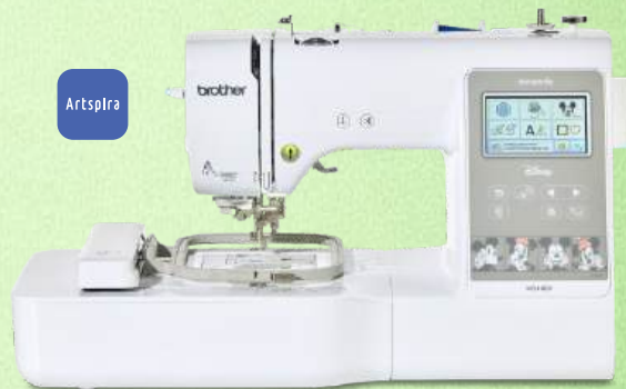
Stickmaschine BROTHER Innov-is M340ED

760 Nutz- und Dekorstiche - 4 Nähalphabet (3 Alphabete, 1 Kyrrillisch) -spiegelungen und Motiv-Wiederholungen - benutzerdefinierte Stiche - Laser-Hilfslinie, 19 mm seitlich verschiebbar - intell. Stich-Regulator - Ober- und Unterfadensensoren bis zu 8-Wege-Seitwärtstransport - Stichplatten-Erkennung - WiFi kompatibel My Custom Stitch-Konnektivität - realistischer Stichvorschau - 12 Bediensprachen vielseitiges Optionales Zubehör (ergonomischer Multifunktions-Fußanlasser, - Stichkombinationen - Bobbin Work Kit und Kreisnäher - 3 Jahre Garantie