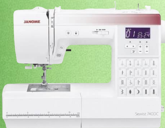
Nähmaschine JANOME Sewist 740 DC

30 Nähprogramme - Multi-LED-Anzeige - 3 Automatische Knopfloche - Zubehörfach 2-fach LED Beleuchtung - Knopflochfuß mit Stabilisierungsplatte - Harthaube - 5 J. Garantie Nadelstopp oben/unten - Nähen ohne Fußanlasser möglich - Zwillingsnadel-Funktion eingebauter Einfädler - Nähgeschwindigkeit stufenlos regelbar - Stichbreite 7 mm Multi-Flex-Füßchen - regulierbarer Nähfußdruck - Freiarm - extra großer Anschietisch