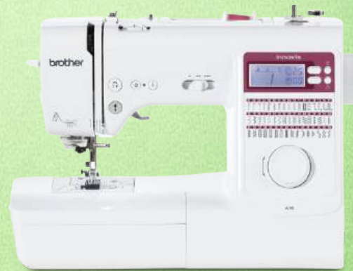
Nähmaschine BROTHER Innov-is A50

16 Stichprogramme, einschließlich drei Knopflochvarianten Komfort-Nadeinfädler - Punktverriegelung - Komfortable Spulautomatik Stopp-Position der Nadel (oben/unten) - Stichlängen- und Stichbreitenregelung Start/Stopp-Taste - Schieberegler für Geschwindigkeit - 3 Jahre Garantie