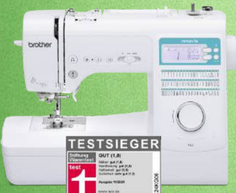
Nähmaschine BROTHER Innov-is A65

50 Stichprogramme, einschließlich fünf Knopflochvarianten Komfort-Nadeinfädler - Punktverriegelung - Komfortable Spulautomatik Stopp-Position der Nadel (oben/unten) - Stichlängen- und Stichbreitenregelung Start/Stopp-Taste - Schieberegler für Geschwindigkeit Wahl des Nadelmodus (Zwilling / Einzel) - Großes LC-Display - 3 Jahre Garantie