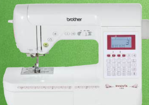
Nähmaschine BROTHER Innov-is F400

150 Stichprogramme, einschließlich zehn Knopflochvarianten 4 einprogrammierte Schriften - Automatischer Fadenabschneider Komfort-Nadeinfädler - Punktverriegelung - Komfortable Spulautomatik Stopp-Position der Nadel (oben/unten) - Start/Stopp-Taste - Schieberegler für Geschwindigkeit - Helles LED-Nählicht Großes LC-Display - 3 Jahre Garantie