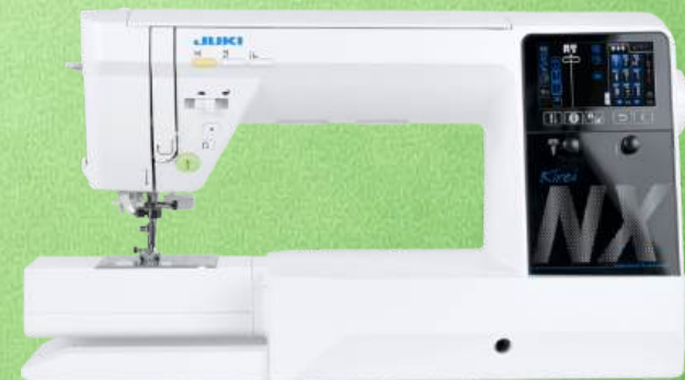
Computer Nähmaschine JUKI HZL-NX7 Kirei

287 Stichmustern, 4 Alphabete, Applikationen, Dekorstichen und Quiltstichen Durchlass: 203 x 115 x 210 mm - Box Transport - Einstellbare Knopflochschnittbreite Fußanlasser mit Fadenabschneidefunktion - LED Beleuchtung - Auto. Nadeleinfädler Integriertes Zubehörfach - Nähfußliftung bis zu 12mm - Multifunktionale Stichplatte Floating-Modus - Nähfuß "schwebt" Fußdruck passt sich an - Kniehebel Stichbreite 7 mm Stichlänge 5 mm - Robuste Kofferhaube - 2+2 Jahre Garantie