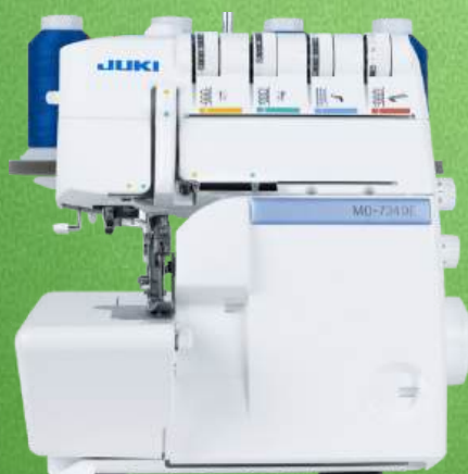
Overlock JUKI MO-734DE

2 / 3 / 4 Fäden - Stichtlänge max. 4 mm, Stichbreite max. 7 mm Differentialtransport - Manuelle Fadenspannung - Rollsaumeinstellung Schnittbreitenverstellung - Abfallbehälter - 2+2 Jahre Garantie