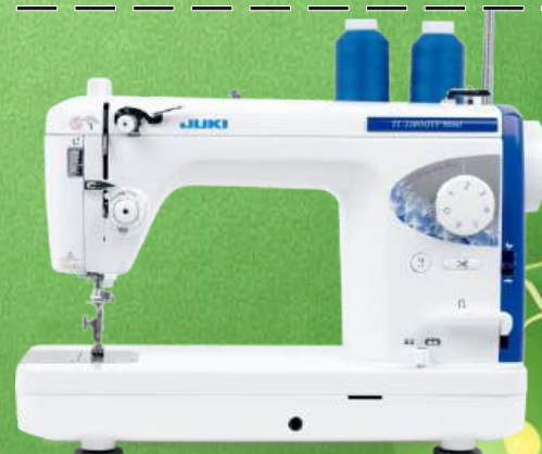
Schnellnäher JUKI TL-2200 QVP MINI

367 Stichmustern, 6 Alphabete - Arbeitsfläche 304 mm x 120 mm Einstellbare Startgeschwindigkeit und elektronische Geschwindigkeitskontrolle Versenkbarer 7-Punkt-Transporteur - Voll integrierter Differential-Oberstofftransporteur Intelligenter Spulenwächter - Exclusive Fadenabschneidefunktion Einstellbarer Fußchendruck - Floating Modus - Nähfuß "schwebt" Fußdruck passt sich an Extra breites Fußpedal mit 7 möglichen Fußpedalfunktionen - Freiarml - Kniehebel Durchlass 304 mm - Gesamtarbeitsfläche 570 mm - WLAN-fähig - 2+2 Jahre Garantie