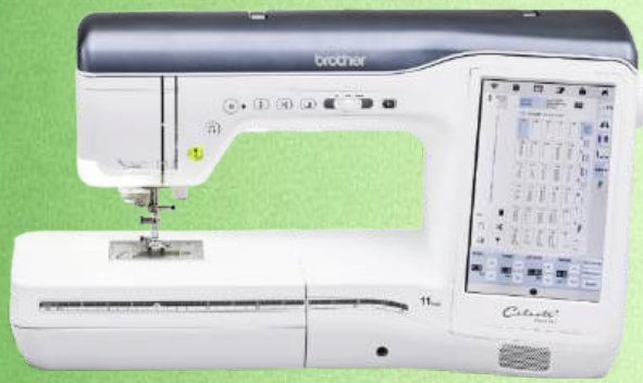
Nähmaschine BROTHER Celeste Innov-is Cx1