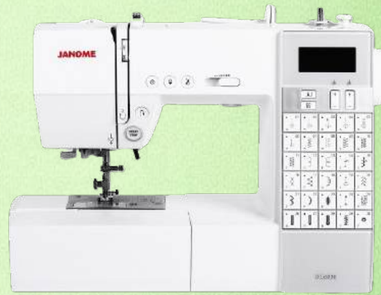
Nähmaschine JANOME DC 6030 inkl. großem Anschietisch

24 Nutznähte Zick-Zack, Elastik Zick-Zack, Blindstich - 1 Stufen-Knopfloch Stichbreite 5 mm, Stichlänge 4 mm - LED Licht - Klemmfreier Horizontalgreifer Snap-on-Füßchen - Verstellbarer Füßchendruck - Nadeleinfädler - Freiarm Integriertes Zubehörfach - Inklusive Zubehör und Harthaube - 5 Jahre Garantie