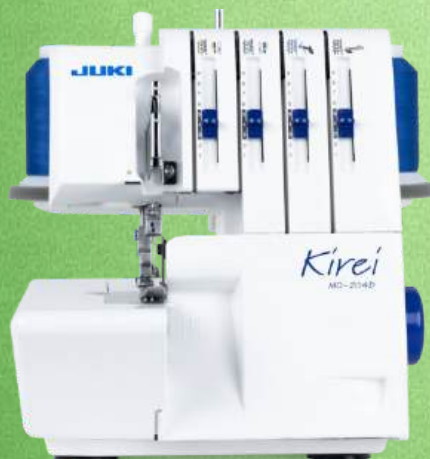
Overlock JUKI MO-204D Kirei

Untergreifereinfädler - Easy-Snap-on-Fuß - Schnittbreitenverstellung Differentialtransport - Rollsaumeinrichtung - Manuelle Stichtlängeinstellung Robustes Messer System - Nähgeschwindigkeit: max. 1500 Stiche/Min Verstellbare Klinge - Stoff-Führung - Staubhülle - 2+2 Jahre Garantie