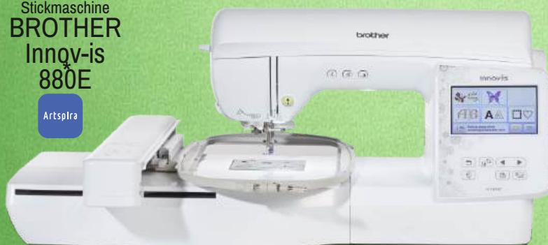
Stickmaschine BROTHER Innov-is 880E

193 einprogrammierte Stickmuster 13 Stickschriften große Stickfläche von 180 x 130 mm - Extra-Komfort-Nadeleinfädler - Farbsortierfunktion Fadenabschneider für Sprungstiche - Drahtlose Verbindung über WLAN - Verbindung mit der App Artspira - 3 Jahre Garantie