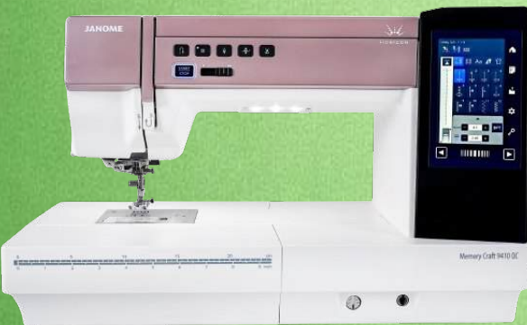
Prof. Quilt- Nähmaschine JANOME MC9410 QC

SALE 10% auf UVP SALE 13% auf UVP SALE 15% auf UVP SALE 17% auf UVP SALE 18% auf UVP SALE 21% auf UVP