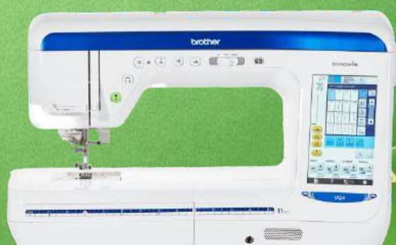
Näh-und Quiltmaschine BROTHER Innov-is VQ 4

473 programmierte Stiche - 285 mm Durchgangsbreite 14 Knopflochvarianten und 5 Schriften - Bis zu 1.050 Stiche/min Extra großer farbiger Touchscreen - Automatisches Einfädeln Verstellbarer Nähfußdruck (elektronisch) - Detailbeleuchtung Automatischer Fadenabschneider - Unabhängige Aufspulautomatik - 3 Jahre Garantie