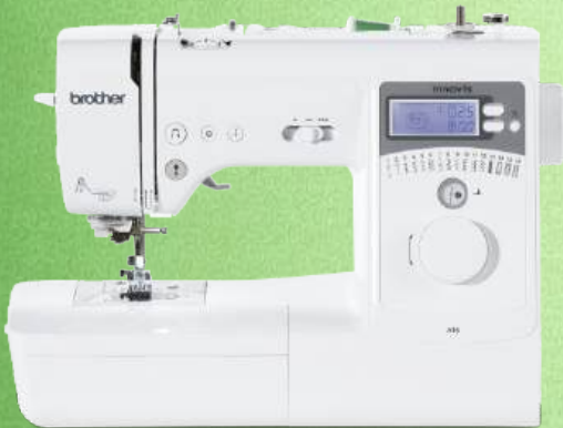
Nähmaschine BROTHER Innov-is A16

Stiftung Warentest meint zum Testsieger Innov-is 10A: „Die ist einfach, gleichzeitig faszinierend und hat alles, was man braucht“ 16 einprogrammierte Stiche - 3 Ein-Stufen-Knopflochvarianten Automatisches Vernähen - Elektronischer Geschwindigkeitsregler Stopp-Position der Nadel oben/unten - Nadeinfädler Unterfaden-Schnellautomatik - Augenfreundliches LED Nählicht Aufspulautomatik - 3 Jahre Garantie