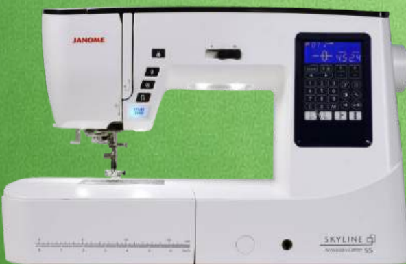
Nähmaschine JANOME Skyline S5 inkl. großem Anschietisch

120 Stiche - 7 automatische Einstufenknopflocher - 3 Nähschriften - 4 Direktwahltasten Multi-Flex-Füßchen - Automatische Fadenspannung - Klemmfreier Horizontalgreifer 7-Segment-Transporteur - Verstellbarer Nähfußdruck - Elektronische Fadenschere Beleuchtetes LC Display - 4 weiße LED Lampen - Arbeitsbereich: 210 mm x 330 mm Start/Stopp-Taste - hoher Nähfußhub - Freiarm / Flachbett wahlweise - 5 Jahre Garantie