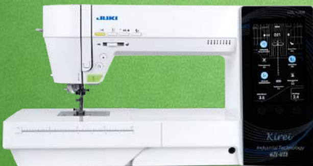
Computer Nähmaschine JUKI HZL-UX8 Kirei

351 Stichmuster, 4 Alphabete - Arbeitsfläche 304 mm x 120 mm - Kniehebel Versenkbarer 7-Punkt-Transporteur - Voll integrierter Differential-Oberstofftransporteur Intelligenter Spulenwächter - Fadenspannungs-Know-How - Touch Panel Floating Modus - Nähfuß "schwebt" Fußdruck passt sich an Extra breites Fußpedal mit 7 möglichen Fußpedalfunktionen Stichbreite 7 mm Stichlänge 5 mm - 2+2 Jahre Garantie