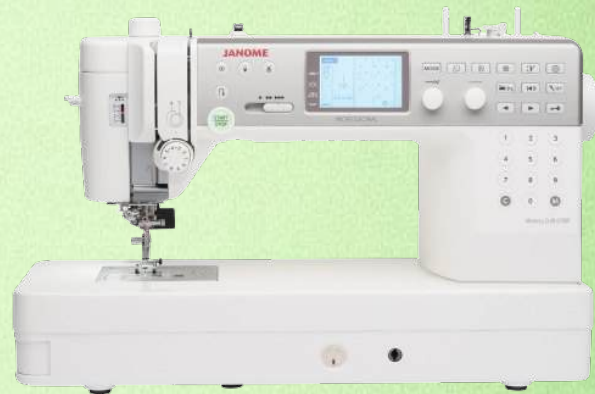
Computer Schnellnäher JANOME MC6700P Schnellnäher

Bis zu 1.600 Stiche pro Minute - Max. Stichlänge 6 mm - Unabhängiger Spulermotor Industrielles Vorspannungs-Einfädler - Nadeleinfädler - Durchlass: B225 x H140 mm Automatischer Fadenschnneider - Extra hohe Nähfußliftung - Bis zu 11lbs des Nähfußdrucks Große Jumbo Spulen - Maße: 498 x 338 x 218 mm - Kniehebel - 5 Jahre Garantie