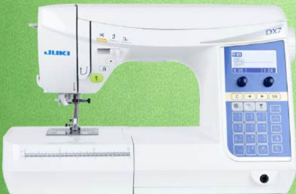
Computer Nähmaschine JUKI HZL-DX7

185 Stichmustern, 3 Alphabete, Applikationen, Dekorstichen und Quiltstichen Durchlass: 203 x 115 x 210 mm - Box Transport - Knopflocher in Industriequalität Automatischer Fadenabschneider - LED Beleuchtung - Automatischer Nadeleinfädler Integriertes Zubehörfach - Nähfußliftung bis zu 12 mm - Robuste Kofferhaube Stichbreite 7 mm Stichlänge 5 mm - 2+2 Jahre Garantie