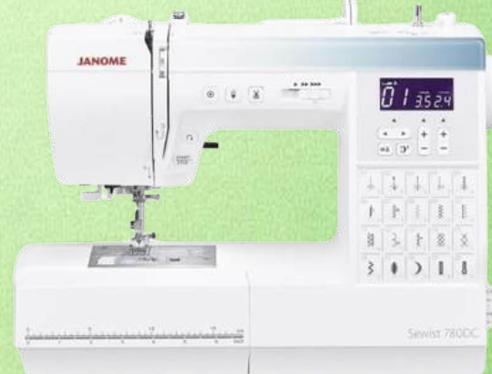
Nähmaschine JANOME Sewist 780 DC

40 Nähprogramme inkl. 3 Knopflocher - 20 Direktauswahltasten - Nadeleinfädler Automatisches Vernähen auf Tastendruck - Dreifachgeradstich bis zu 4 mm Stichlänge 5 mm - Stichbreite 7 mm - Multiflex-Füßchen mit Snap-On-System Multi-LCD Display - Start + Stopp-Taste - Verstellbarer Nähfußdruck - LED Licht Klemmfreier JANOME Greifer - 5 Jahre Garantie