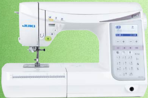
Computer Nähmaschine JUKI HZL-DX3

180 Stichmuster, Applikationen, Dekorstichen und Quiltstichen - 7-Punkt-Transporteur Alphabet mit Groß- und Kleinbuchstaben - 8 verschiedene Knopflocher - LED Beleuchtung Verstellbarer Nähfußdruck - Halbautomatischer Nadeleinfädler - Robuste Kofferhaube Spezieller Stahltransporteur für starken Transport bei schweren Stoffen Nähfußliftung bis zu 12 mm - Inkl. Kniehebel - Durchlass Höhe 203 mm, 112 mm Durchlass Stichlänge 5 mm - Stichbreite 7mm - 2+2 Jahre Garantie