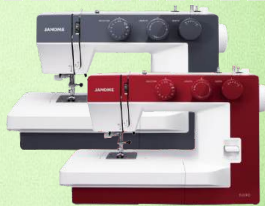
Mechanische Nähmaschine JANOME 1522BL 1522RD

12 Nutz- und Stretchstiche - 4 Stufen-Knopfloch - 5mm Stichbreite 4 mm Stichlänge - inkl. Sicherheitsnähuß (Fingerschutz) Maximal 650 Stiche / Minute - Klemmfreier Horizontalgreifer Helles LED Licht - Einfädler - Snap-on-Füßchen - 7 Punkt Transporteur Freiarm - 5 Jahre Garantie