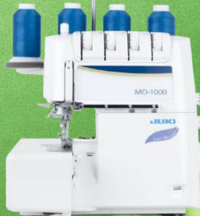
Overlock JUKI MO-1000

Einfädeln mit Farbcode - Untergreifereinfädler - Differentialtransport - Abfallbehälter Automatischer Rollrand - Automatischer Nadeleinfädler für beide Nadeln Easy-Snap-on-Fuß - Nähfußfront extra hoch einstellbar - Integrierte Stoffführung Schnittbreitenverstellung - 2+2 Jahre Garantie