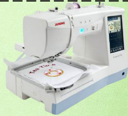
Näh + Stickmaschine JANOME MC 1000