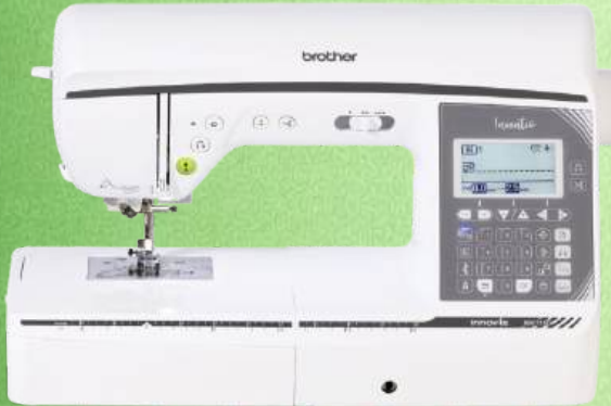
Näh-und Quiltmaschine BROTHER Innov-is NV 1150

40 einprogrammierte Stiche, Nutz-und Dekorstiche - 6 Knopflochvarianten LCD-Bildschirm - Stopp-Position der Nadel - Punktverriegelung Automatisches Einfädeln - Aufspulautomatik - Klemmfreier Horizontalgreifer Rechteckiges Transportsystem - Verstellbarer Nähfußdruck (elektronisch) LED-Beleuchtung - Kniehebel - Zubehörfach - Kofferhaube - 3 Jahre Garantie